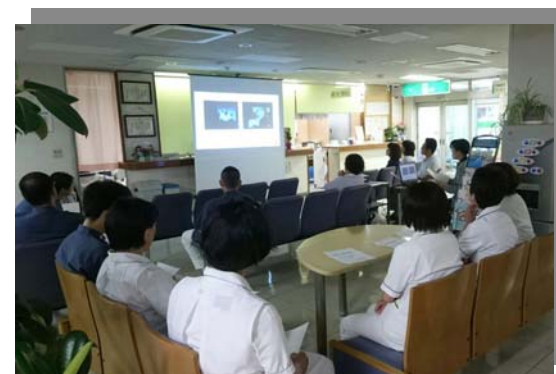
外来ホールで行われた院内報告集会の様子